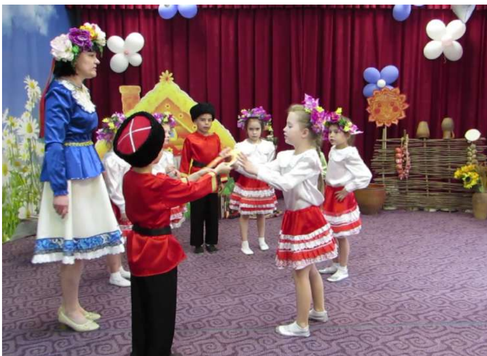
Рис. 2. Игра «Подкова»

Весело резвился в поле Жеребёночек на воле Он в густой траве скакал И подкову потерял