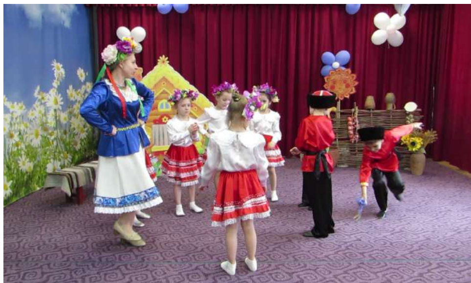
Рис. 1. Игра «Заря-Заряница»

Что развивает игра: умение соблюдать правила, проявлять доброжелательность; приобщение к национальной культуре Кубани; воспитание патриотических чувств посредством кубанской народной игры.