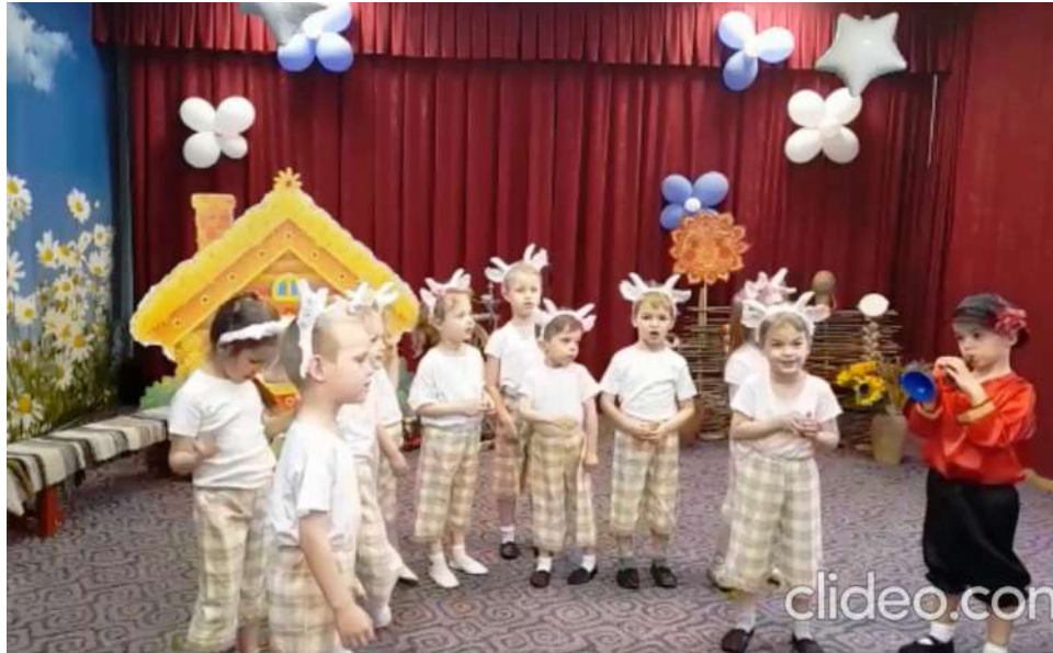
Рис. 3. Игра «Волк и козлята»

Пастушок выгоняет козлят на лужок; козлята резвятся, бегают, прыгают, веселятся! Внезапно появляется волк.